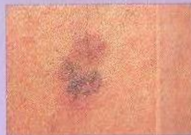
Queratoses Actínicas. Lesões pré-malignas